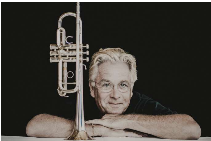
Håkan Hardenberger dirigerar Malmö SymfoniOrkester den 7:e december på Malmö Live.