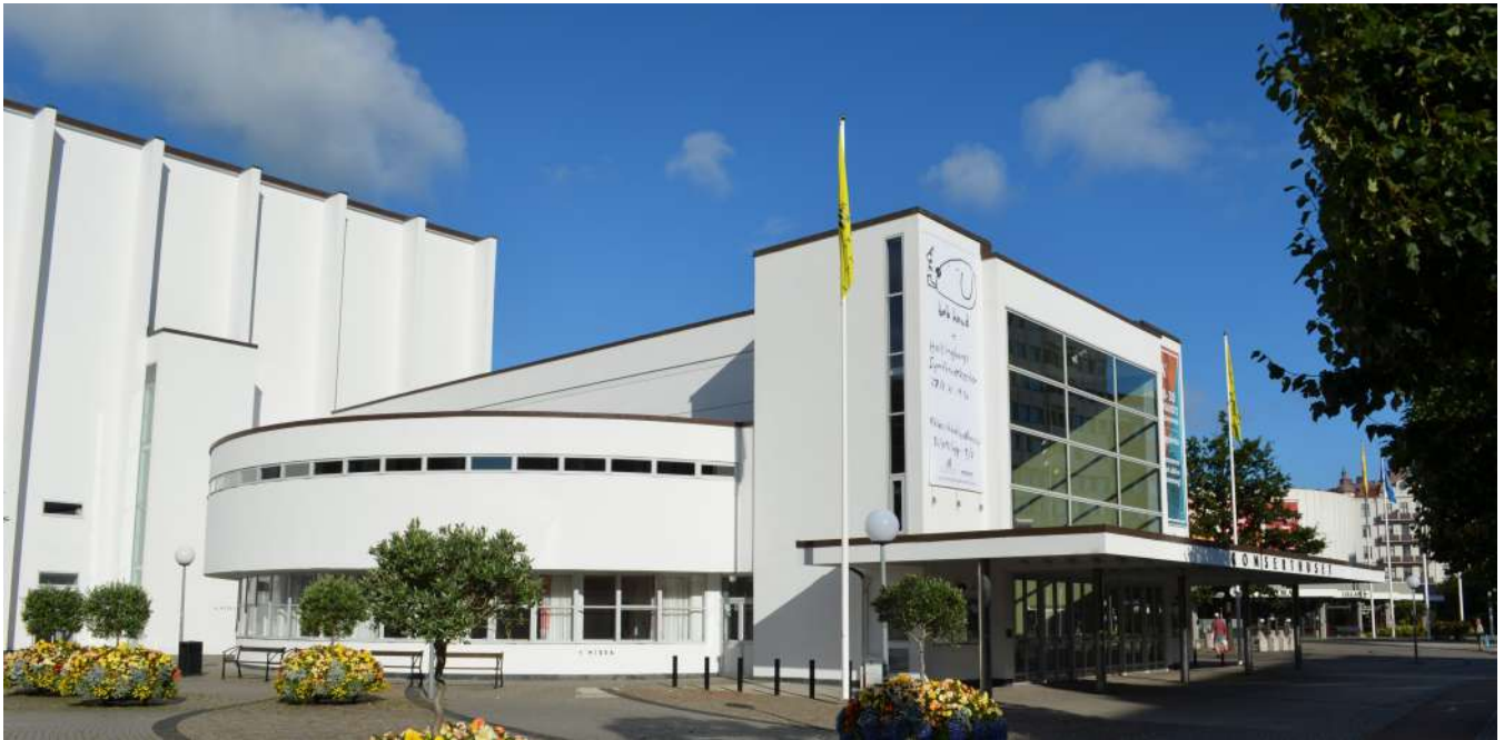
Helsingborgs stiliga Konserthus bjuder in till ett fint konsertprogram.

musik men med en historia som man kanske inte ska ta på allra största allvar. Säkert en fin uppsättning som det alltid är på Malmö Opera.