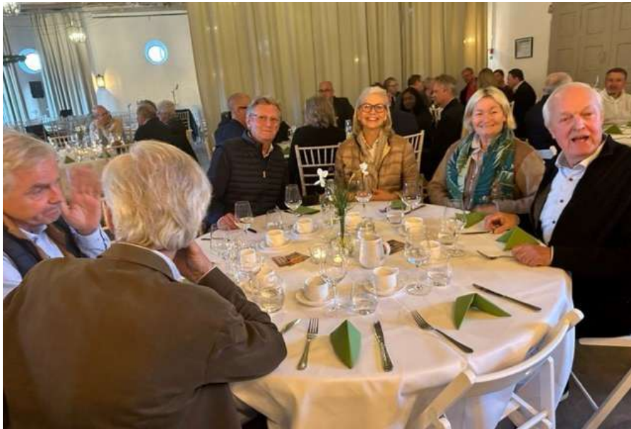
I väntan på den synnerligen välsmakande maten från Svaneholms slottsrestaurang.

Maldivernas klimatsändebud i FN gav en egenupplevd bild av hur klimatförändringen påverkar henne, hennes familj och Maldiverna som land. Från att i ungdomen ha upplevt en sorglös tid med "fri tillgång" till friskt vatten, till idag då grundvattnet blivit så kontaminerat att allt vatten måste renas. Idag går det åt mer medel från Maldivernas offentliga sektor till att rena vatten än det går åt till utbildningssystemet. Denna förändring har skett på mindre än 30 år.