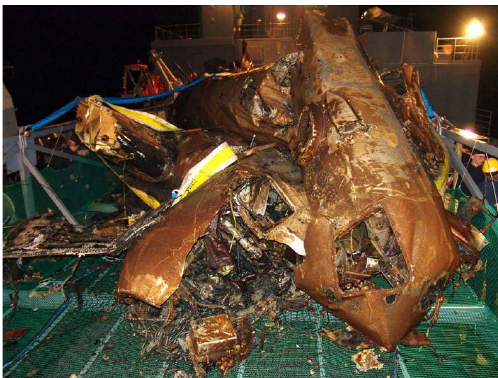
Resterna av DC3:an som 2004 togs upp på däck på räddningsfartyget Belos.

Medlem av Skånska Akademien och ordförande i Svenska Astronomiska sällskapet