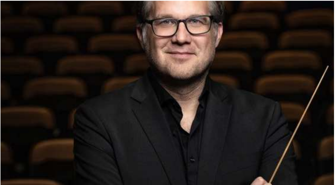
Nils-Peter Ankarblom.