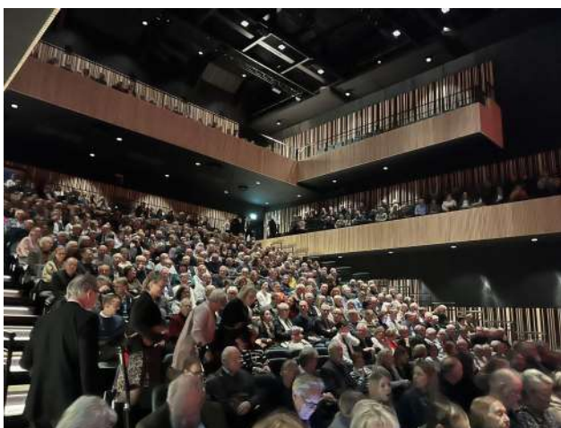
Konserteralen Science Village Hall.

Men hur ser det ut idag drygt 20 år senare? Vi trodde nog, eller hoppades i alla fall på att det skulle fortsätta med flera spännande samverkansprojekt och ett flöde av besökare från andra sidan sundet. Men riktigt så blev det nog inte. Visst har vi ett rikt och många gånger nyskapande kulturliv, med många scener och konstmiljöer i Öresundsregionen. Men det vi saknar är ett mer sammanflätat kulturliv med fler spännande och utvecklade konstnärliga samarbeten över sundet. Eller är det kanske så att det är mångfalden och delvis olikheterna som gör den här regionen till en kreativ kulturmiljö för både utövare och publik? Men jag kan ändå önska att nyfikenheten om vad som händer på andra sidan sundet skulle vara något mer omfattande. Vi kan dock konstatera att det är svårt att finna en annan internationell miljö där två länder med så starka kulturella identiteter och resurser ligger så tätt intill varandra. Låt oss hoppas att allt fler ser detta och lockas till att besöka denna rika kulturregion.