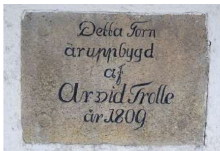
Ovan: Minnesplattan över tornets uppförande.

Kyrkan står utan torn till 1809 då det nuvarande tornet reses.