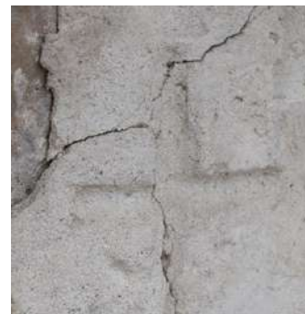
Det kors som murarna ristat på absidens vägg

I normala fall är absid och kor en enhet i Skånes medeltida kyrkor, vilka uppförs från öster mot väster. Men i Fulltofta är det inte så. Både absid och långhus har här adderats till det ensamma koret. I samband med att man byggde koret, antingen rasar eller revs korets östra gavelröste. En större sten med kvarsittande puts har sekundärt hamnat i gavelröstet östsida i samband med att gavelröstet återuppfördes. I den östra gavelns fogbruk har ett kors markerats i den våta putsen av 1100-talets byggnadsarbetare. Detta har inte varit synligt för andra än de själva. Alltså ett tydligt bevis för arbetarnas personliga from-het. Korets västra gavelsida har delvis murats om när långhuset adderades till koret.