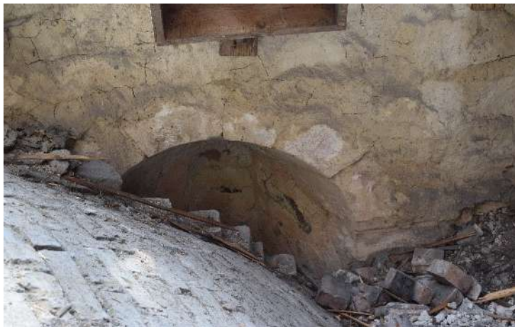
Romanskt fönster som satts igen när valven slogs. Notera detaljbilden till höger av inhugget kors.

Att absiden är sekundär syns tydligt av att en fog med tillhörande dekorativ rits kan följas bakom skarven mellan kor och absid på kyrkans nordsida.