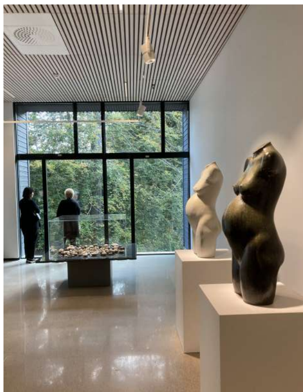
Kraitsalen i den nya konsthallen Ravinen, Båstad

Vollmers, Malmö Mutantur, Malmö Weinbergs, Trelleborg Gastro Gaspari, Flyinge