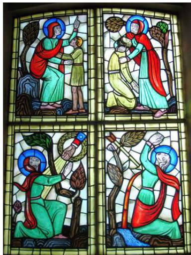
Hugo Gehlins framställning av S:ta Magnhilds-legenden i form av glasfönster från 1936

tera, knappt mässa en gång om året och till råga på allt: där, var folket fordom vakade hela natten i lov-sånger till Gud, komma nu spelmän och sångare tillsammans, som ingalunda blygas för att utföra oanständiga sånger och danser och bedriva fros-seri, dryckenskap och skörlevnad, till det gudomliga majestätets skymf, sina själars fara och mångas förargelse”.